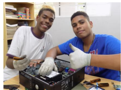
Im Hardware-Unterricht lernen die Jugendlichen die Computer zu Reinigen und zu Reparieren – und in Simulationen ganze Computer zusammenzubauen.