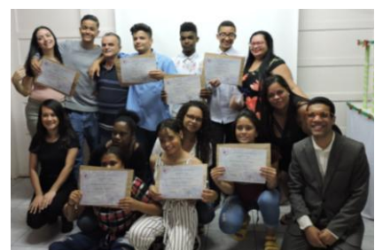
Die Abschlussklasse des 2. Semesters mit ihren Lehrern.