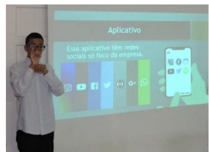
Präsentation in Gebärdensprache der Abschlussarbeit über den Einsatz von sozialen Medien in Unternehmen.