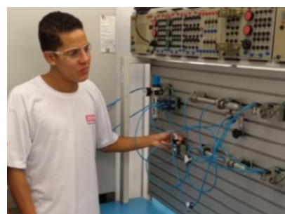
ein Elektriker-Lehrling in der SENAI in Botucatu.