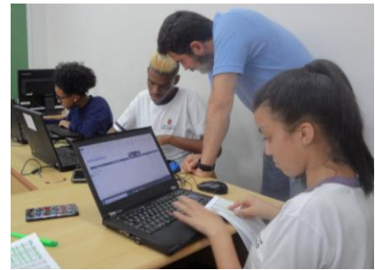
Informatik-Unterricht im Projekt NC-PCD's.

Dieses Jahr werden zwei Kurse in der CASA SOFIA von BRASCRI durchgeführt, die vom 27. Januar bis 3. Juli und vom 27. Juli bis 10. Dezember stattfinden. Wir rechnen damit, 16 Jugendliche ausbilden zu können.