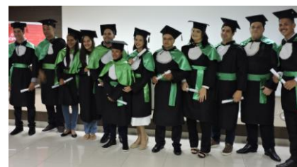
Abschlussklasse mit Diplomen des Berufskurses Bäcker in der SENAI.