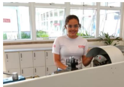
Eine Werkmechanikerin und ...

Im 2019 hat NOVA CHANCE insgesamt 67 Studenten betreut, von denen sieben ihren Kurs abbrachen und acht Studenten ihre Ausbildung im 2020 fortsetzen. Von den 52, die ihre Ausbildung Ende 2019 abschlossen, haben 21 eine Anstellung gefunden.