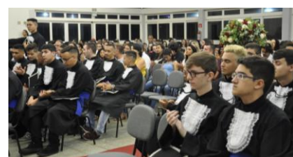
An den Abschlussfeierlichkeiten in Botucatu und Jaú.